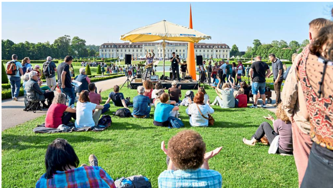
Mehr als 30 Künstler treten drei Tage lang an verschiedenen Orten im Blühenden Barock auf.