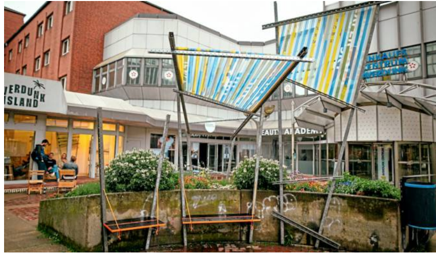
Aus Werbebannern schaffen die Künstlerinnen und Künstler von Trash Galore gemeinsam neue öffentliche Räume.

Unter dem Motto „Building Common Spaces“ hat TRANSURBAN im